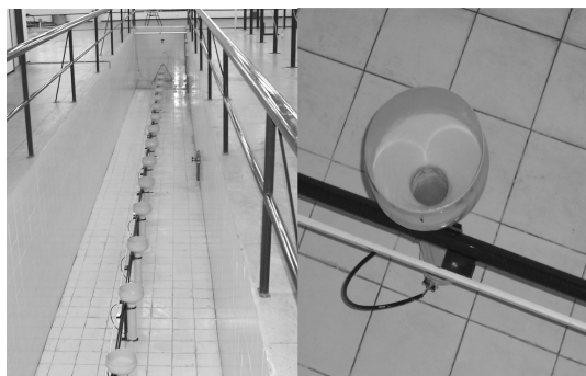
Figura 2 – Imagens do circuito de coletores e do coletor desenvolvido e instalado no LEEI.

Este intervalo de valores é suficiente para se confeccionar um perfil de distribuição de água de um aspersor convencional de acordo com as especificações contidas em ABNT (2000).