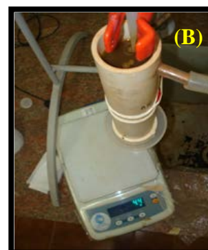
Figura 1. (A) Preparação da coluna de PVC e (B) Início do teste da curva de distribuição de efluentes.