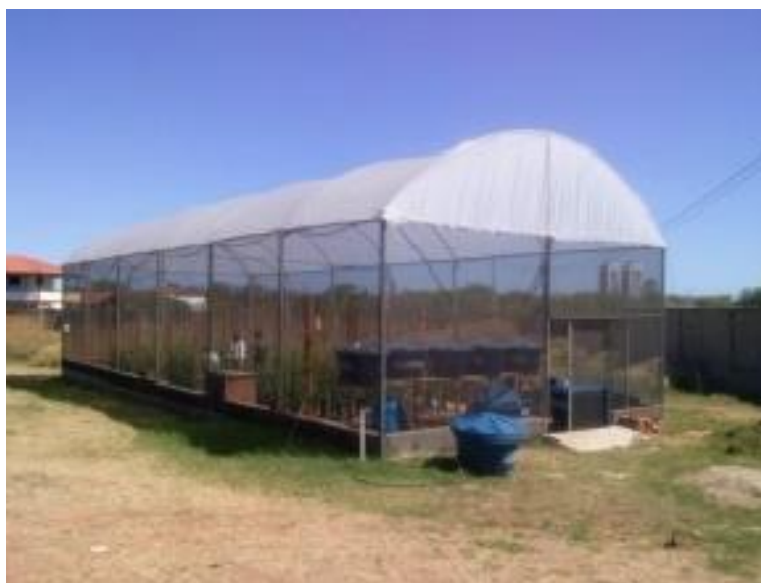
Figura 1 – Local de condução do experimento.

O trabalho foi realizado em ambiente protegido no Departamento de Ciências Ambientais da Universidade Federal Rural do Semi-Árido (UFERSA), situado no município de Mossoró-RN (5° 11' S, 37° 20' W e 18 m) (Figura 1).